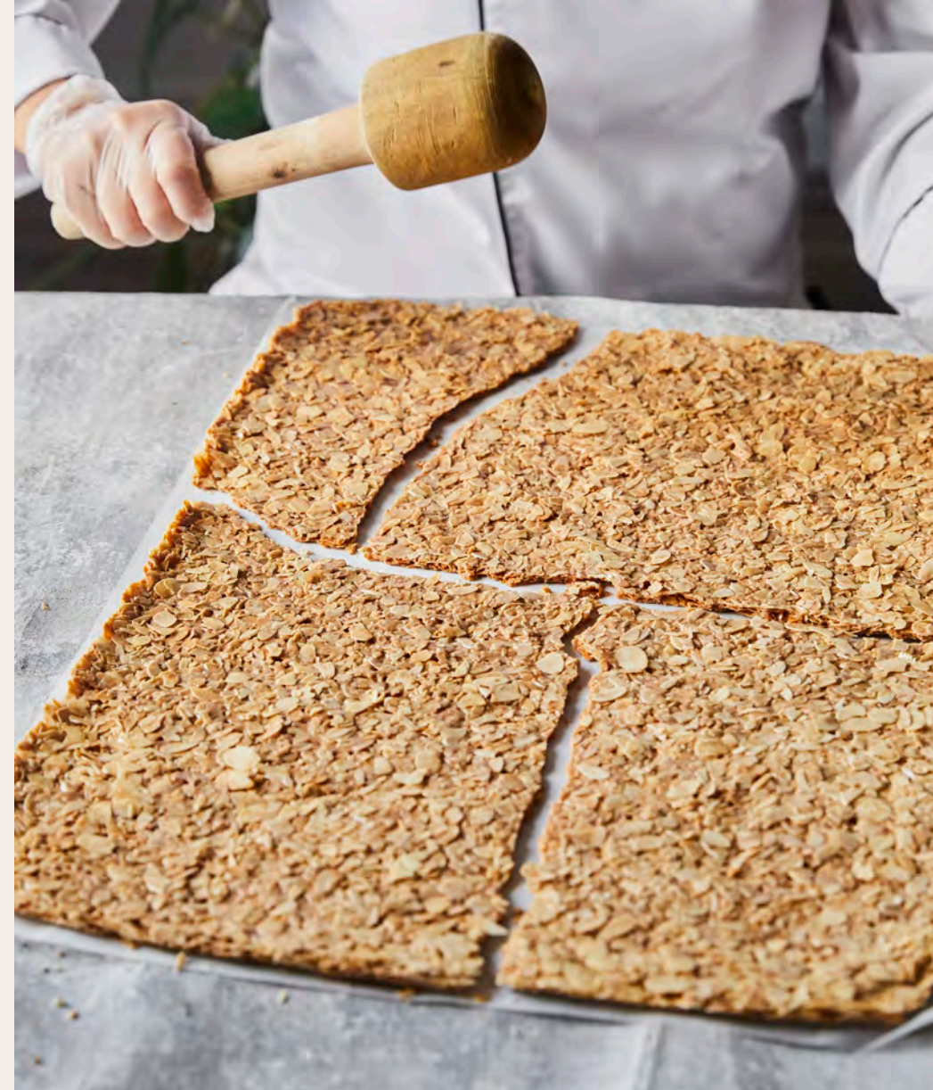
From Nagwa's Photography Portfolio: Our photos tell our delicious story!