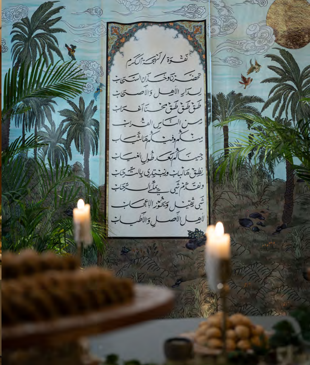
Catering for the opening night of Nagwa Flagship Store in Riyadh, KSA.