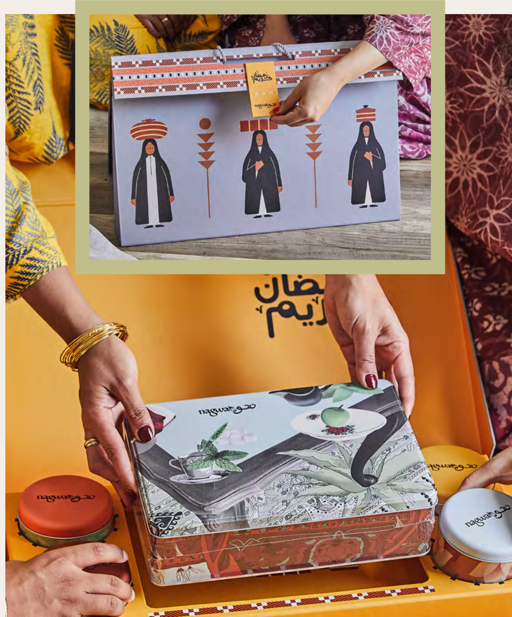
From Nagwa's past curated experiences: Ramadan Gifting Season...